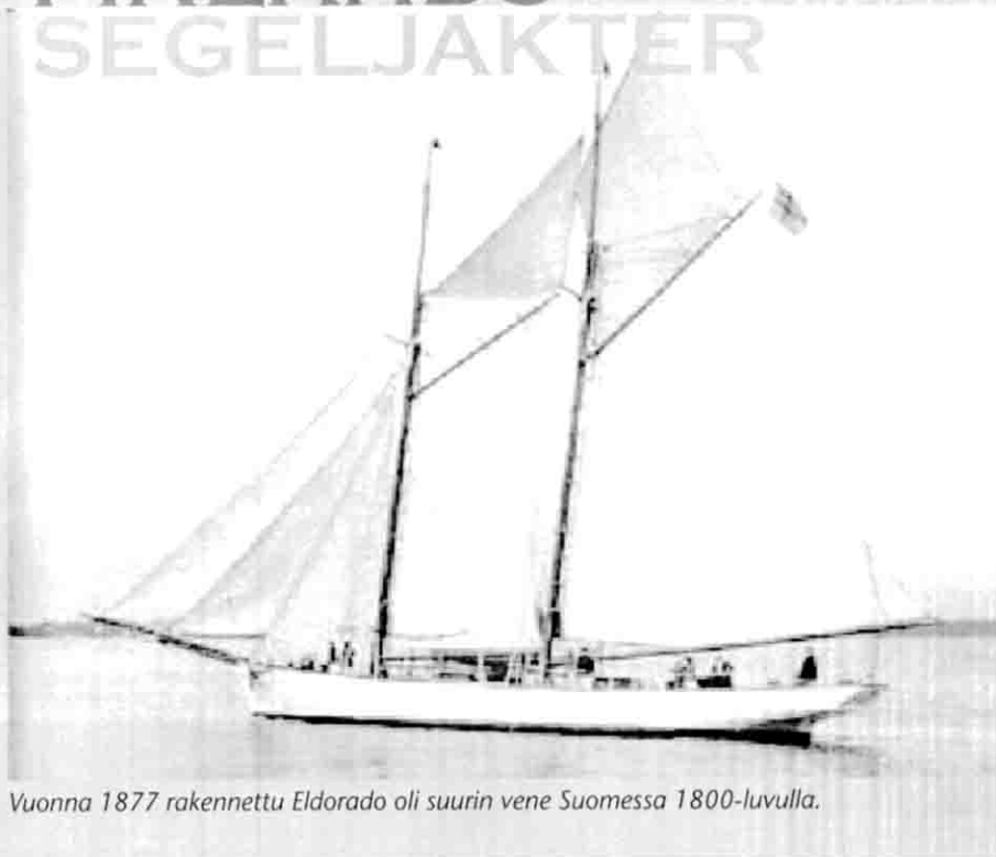
Vuonna 1877 rakennettu Eldorado oli suurin vene Suomessa 1800-luvulla.