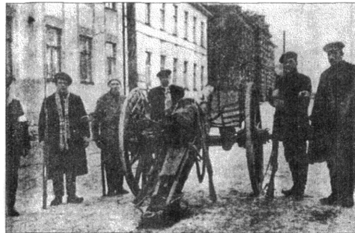
Kanonställningen på Rådhusgatan i Vasa var den första som de vita erövrade.