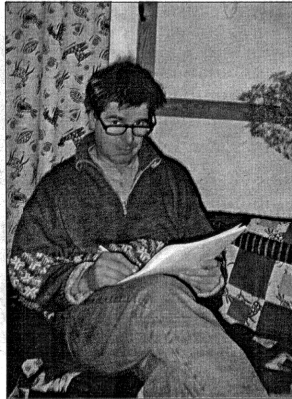
Författaren Tom Paxal gör en rapid tillbakablick på sina spretiga ungdomsår utifrån miljöer hämtade från Hangö, Ekenäs och Helsingfors, i kombination med sjömanslivets buskigheter.

Av mer allmänt intresse är beskrivningarna av författaren och riksdagsman-nen Tommy Tabermanns utsvävningar och uttalanden, där de möttes i likar-